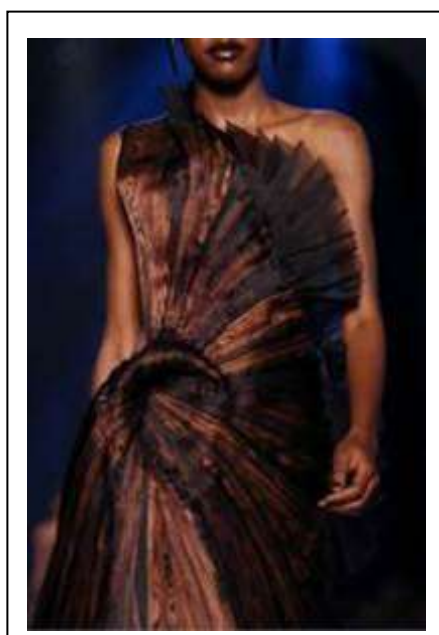
تصميم يعتمد علي الدمج بين التصميم البناني باستخدام التشكيل بالكسرات و التدرج اللوني في الصبغات المستخدمة, Mcqueen2011(10)