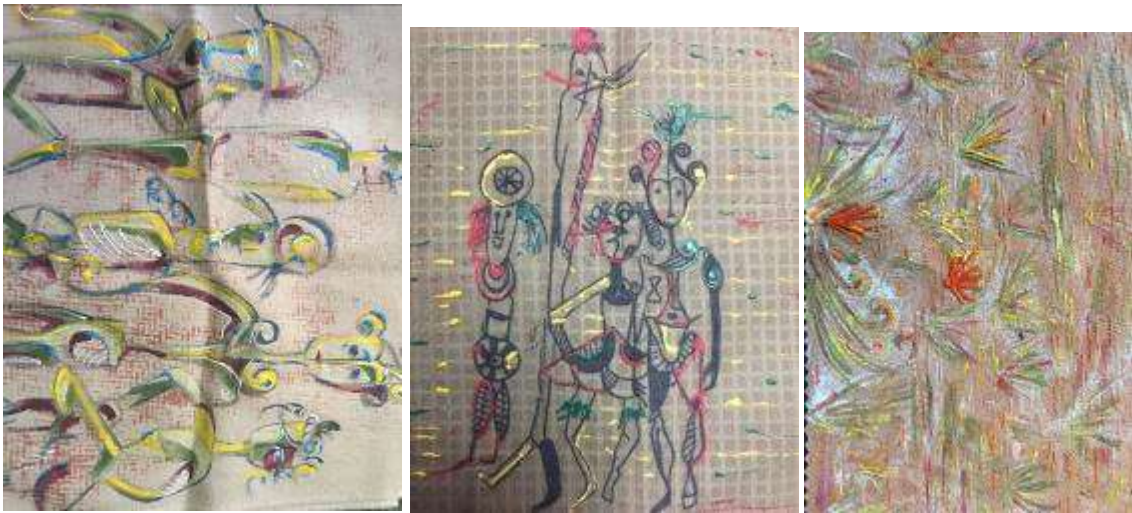
تجارب تشكيل سطح الخامة مستخدما أساليب الطباعة بتقنيات الطباعة بالمونوبرنت و التطريز