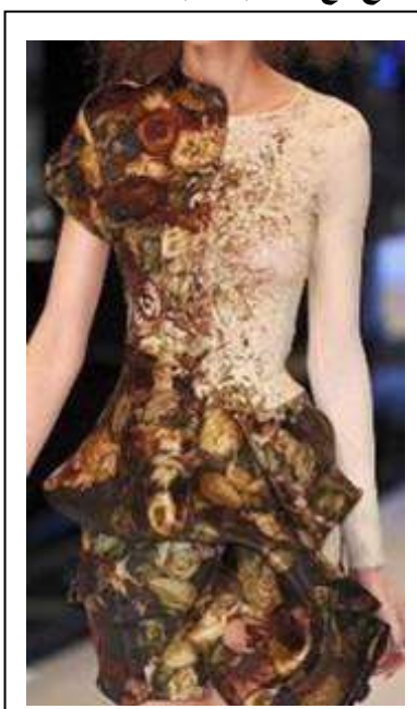
تصميم يعتمد علي الدمج بين التصميم البناني باستخدام أسلوب التشكيل و الخامه المطبوعه Galtier 2016(10)

نماذج من أعمال مصممي الأزياء معتمدة علي تشكيل سطح الخامه بالدمج مع أساليب الطباعة