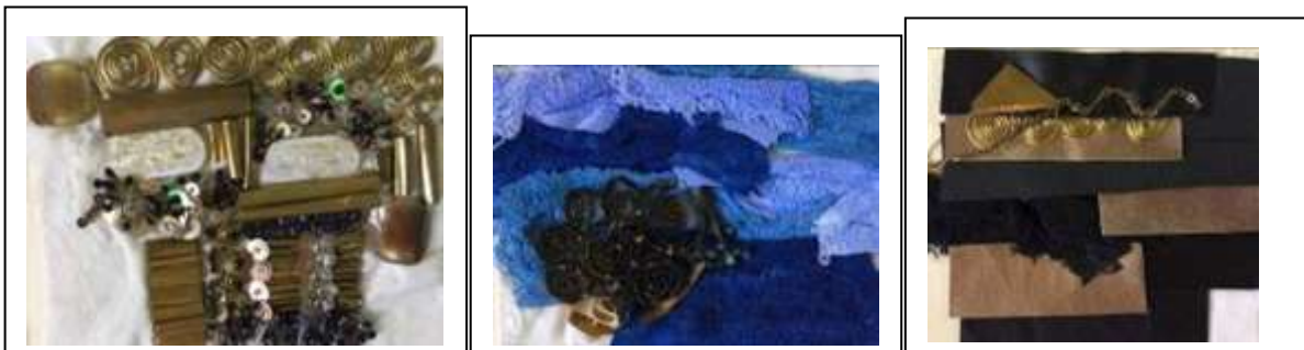
تجارب تشكيل سطح الخامة منقذة باستخدام خامات مختلفة كالنحاس و الخرز و الجلد وخامات متنوعة من الأقمشة