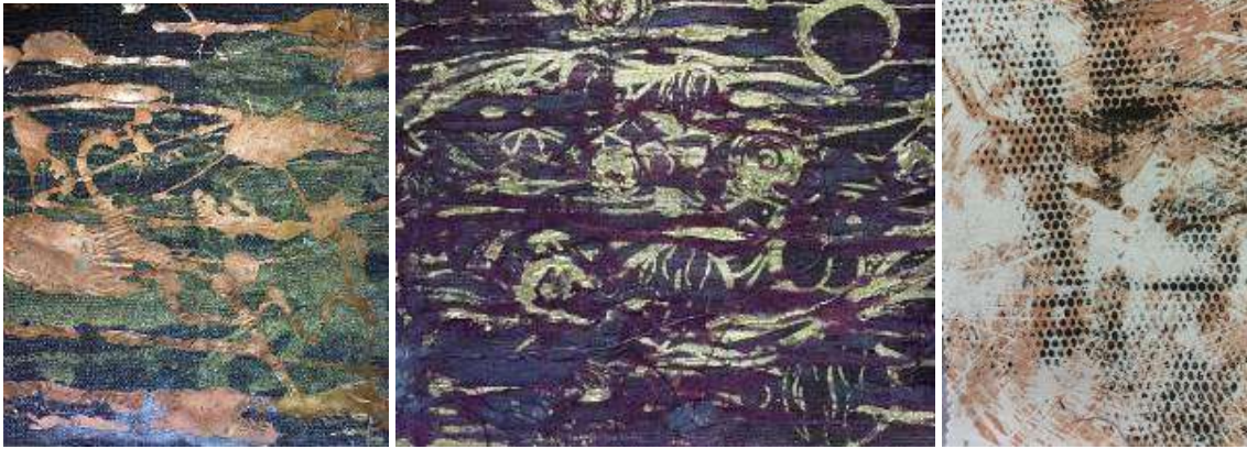
تجارب تشكيل سطح الخامة مستخدما أساليب الطباعة بتقنيات بالمونوبرنت و الطباعة بالفويل